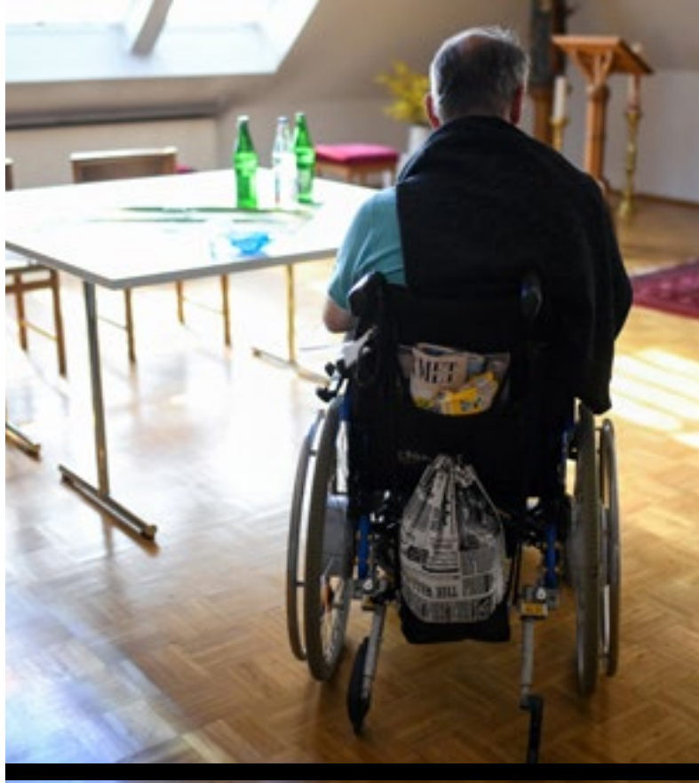
De ziekte volgt jou als de schaduw die in de zomer bij je blijft.

Kun je de ziekte van Parkinson accepteren? De diagnose van zo'n progressieve ziekte zet je leven op z'n kop. Via een haarspeldbocht kom je ineens terecht in de rauwe werkelijkheid van het leven waarbij, afhankelijk van de ziekte, je niet meer degene bent die je was en niet zult worden wie je nu bent. De ziekte volgt jou en (als je dat hebt) jouw gezin als de schaduw die in de zomer bij je blijft. Je zult met een dergelijke ziekte moeten leven en telkens nieu-